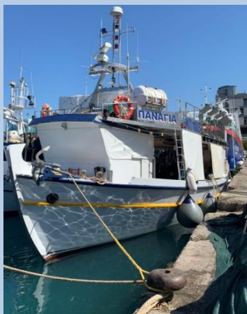
Το Α/Κ "ΠΑΝΑΓΙΑ", Ν.Π.11005, στην Ιχθυόσκαλα Πατρών